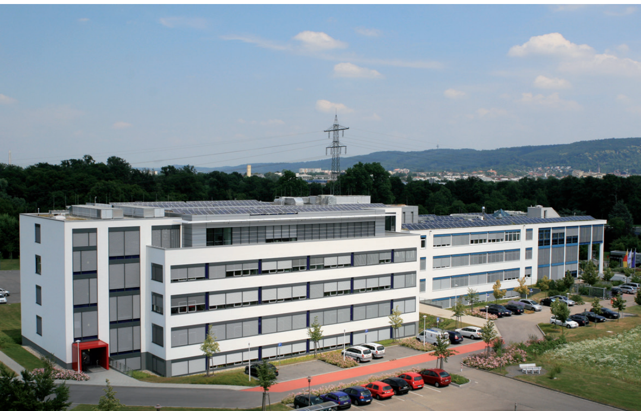
Hauptsitz der Bruker Optics in Ettlingen. Bruker Optics headquarter in Ettlingen, Germany.

You learn the functionality of the Mid-IR, Near-IR and Raman spectroscopy under expert guidance as well as how to use it with different and optimized measurement techniques.